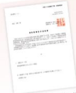
自身でも2014年に創業補助金を採択をされた。