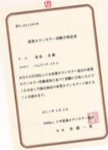
産業カウンセラーを取得