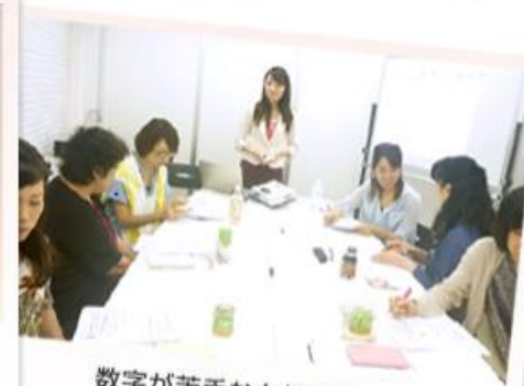
数字が苦手な女性でもわかりやすく説明。